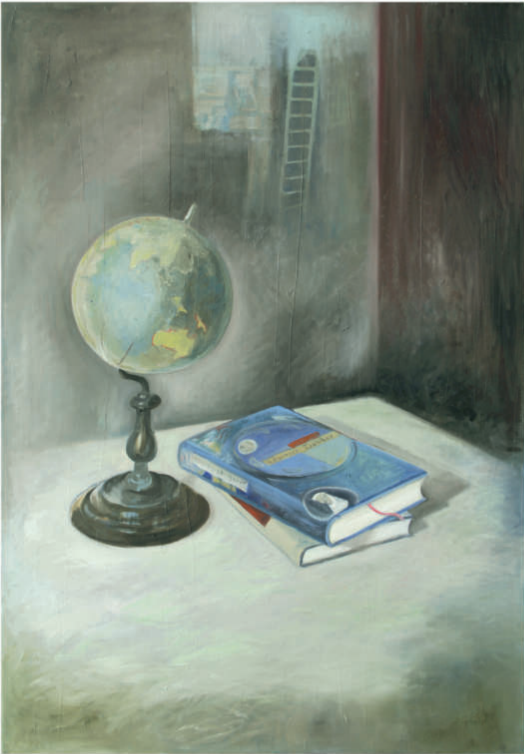
ex libris 14/2018/Öl auf Leinwand 100x70 cm