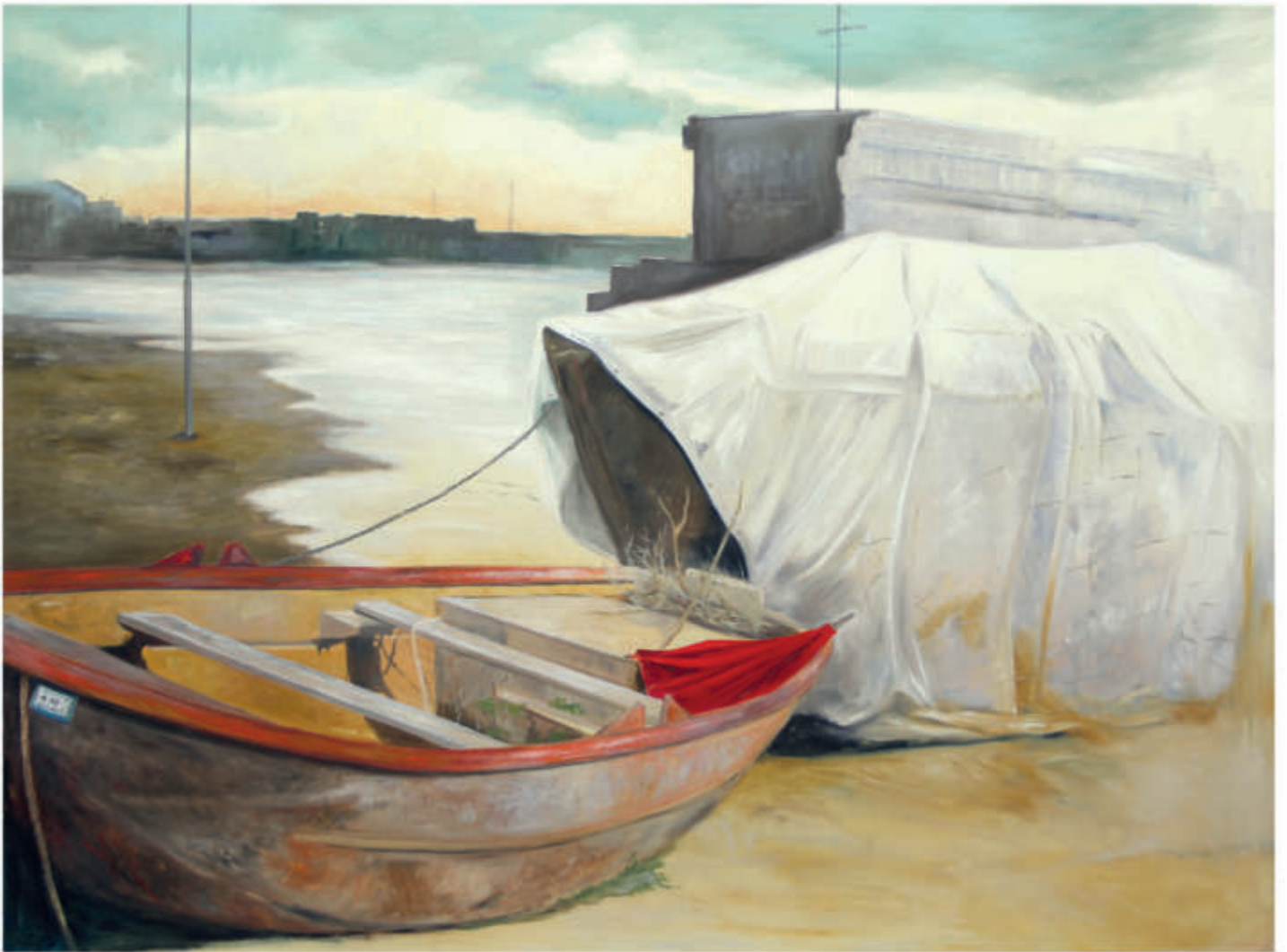
links: Logbuch 16/2019/Öl auf Leinwand 120x90 cm rechts: Logbuch 7/2018/Öl auf Leinwand 120x150 cm