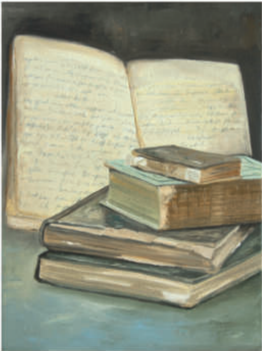
links: ex libris 34/2019/Öl auf Leinwand 40x30 cm rechts: Logbuch 2/2019/Öl auf Leinwand 120x150 cm