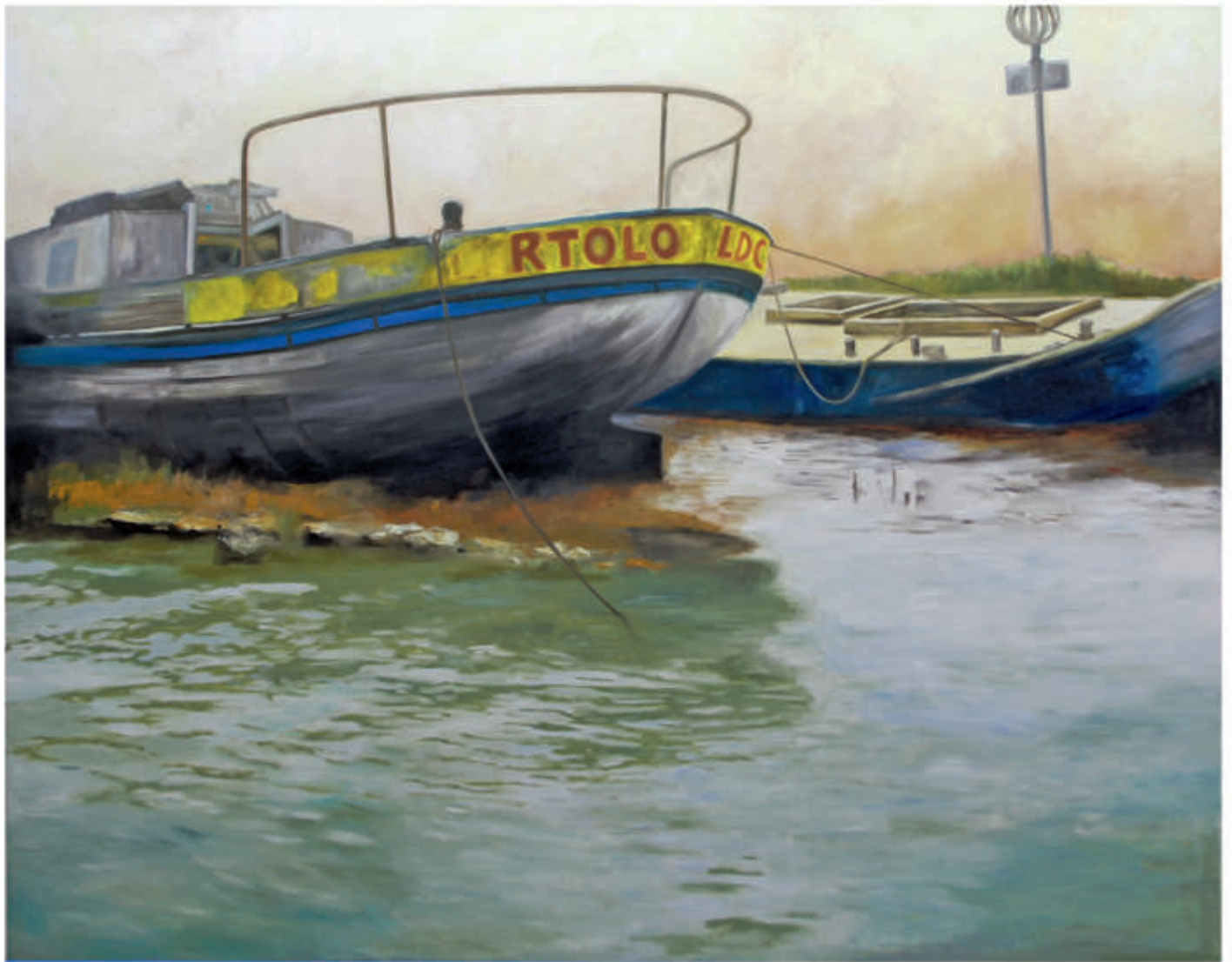
Logbuch 6/2018/Öl auf Leinwand 120x150 cm