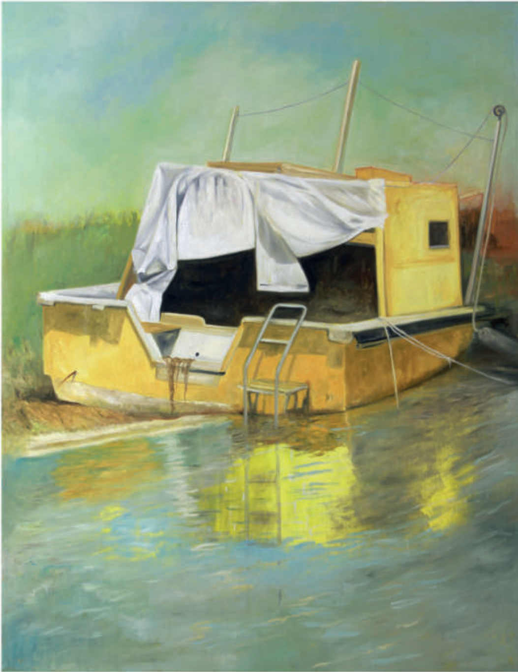
Logbuch 5/2018/Öl auf Leinwand 130x100 cm