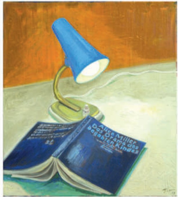
links: ex libris 27/2018/Öl auf Leinwand 130x60 cm rechts: ex libris 5/2017/Öl auf Leinwand 45x40 cm