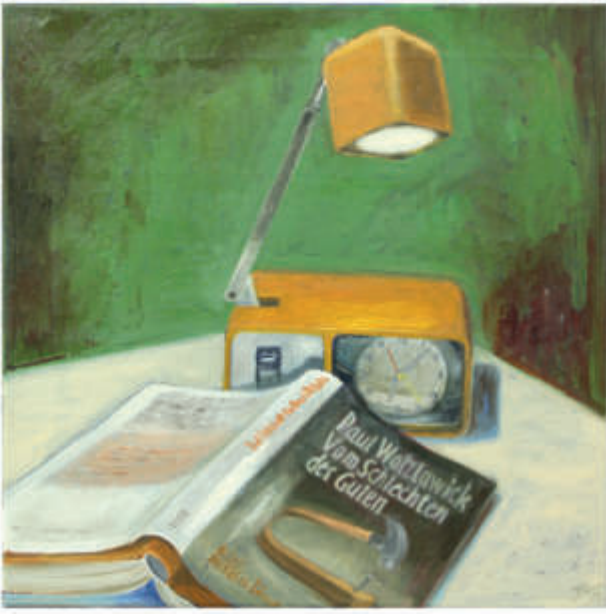
links: ex libris 23/2018/Öl auf Leinwand 40x40 cm rechts: ex libris 19/2018/Öl auf Leinwand 180x80 cm