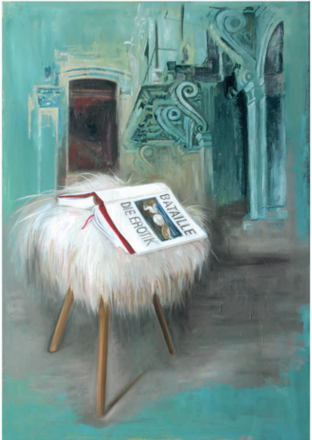
ex libris 13/2018/Öl auf Leinwand 100x70 cm