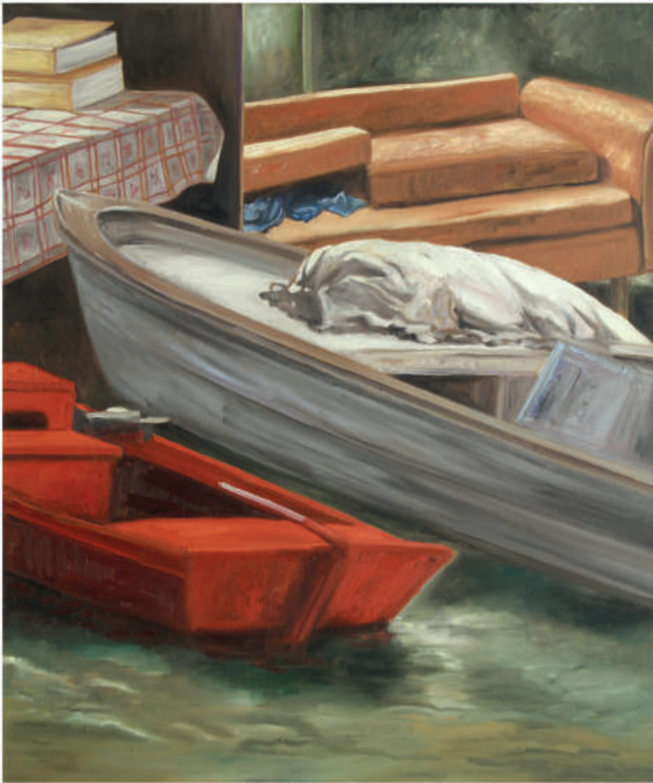
links: Logbuch 11/2019/Öl auf Leinwand 70x60 cm rechts: Logbuch 4/2018/Öl auf Leinwand 120x150 cm