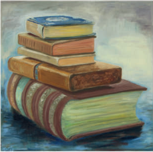
links: ex libris 4/2017/Öl auf Leinwand 50x50cm rechts: ex libris 2/2017/Öl auf Leinwand 120x100cm