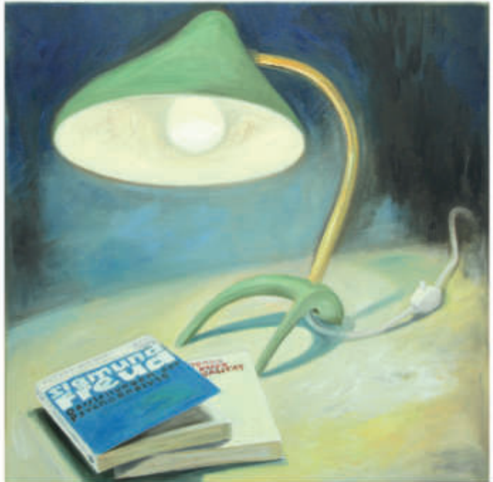
links: ex libris 1/2017/Öl auf Leinwand 100x120 cm rechts: ex libris 11/2018/Öl auf Leinwand 50x50 cm