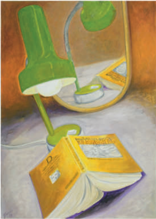
links: ex libris 28/2018/Öl auf Leinwand 55x40 cm rechts: ex libris 26/2018/Öl auf Leinwand 130x60 cm