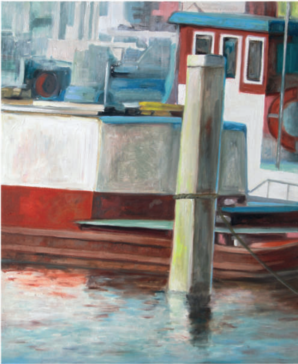
links: Logbuch 9/2018/Öl auf Leinwand 60x50 cm rechts: Logbuch 10/2018/Öl auf Leinwand 120x90 cm