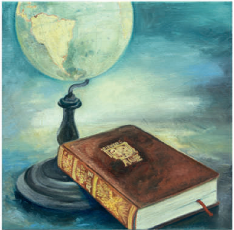
links: Logbuch 12/2019/Öl auf Leinwand 120x100 cm rechts: ex libris 30/2019/Öl auf Leinwand 50x50 cm