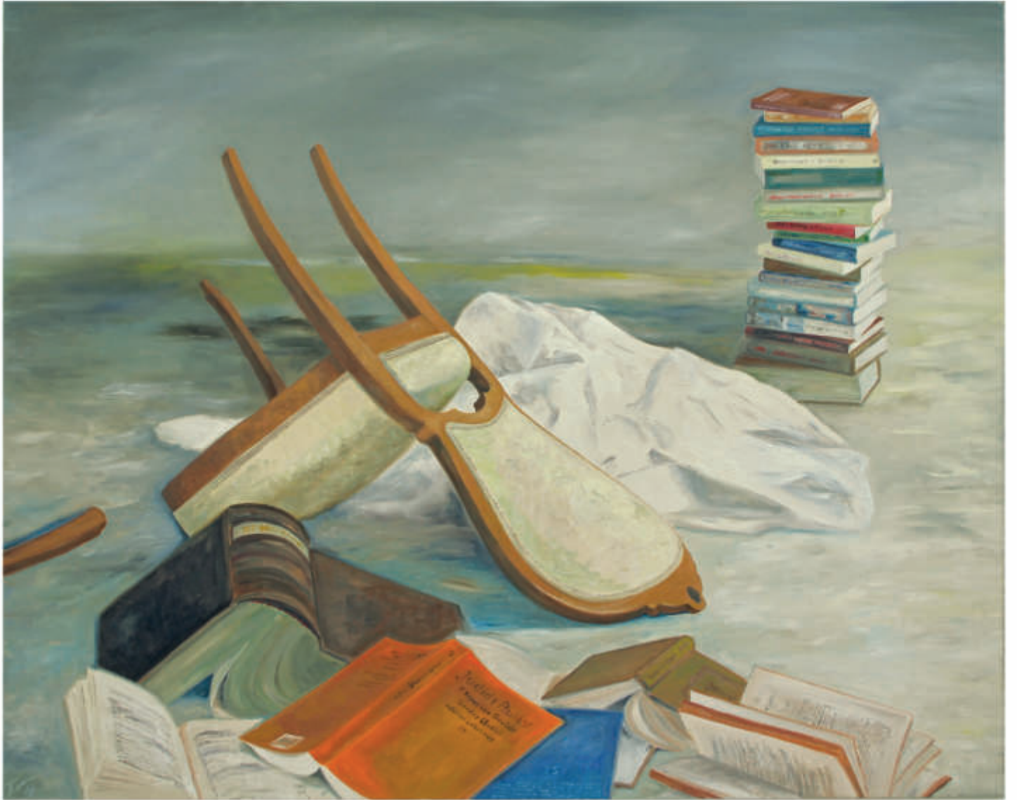
ex libris 18/2018/Öl auf Leinwand 120x150 cm