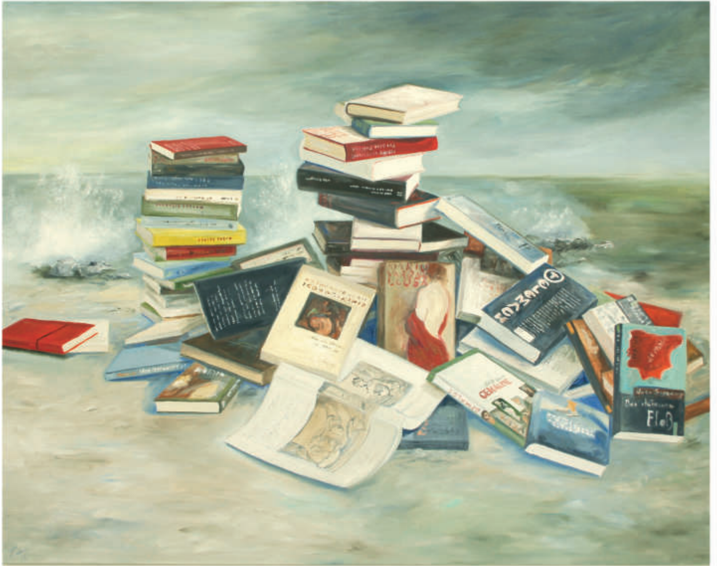
ex libris 17/2018/Öl auf Leinwand 120x150 cm