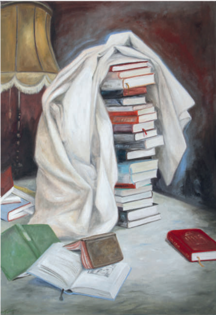
links: ex libris 15/2018/Öl auf Leinwand 100x70 cm rechts: ex libris 24/2018/Öl auf Leinwand 130x60 cm