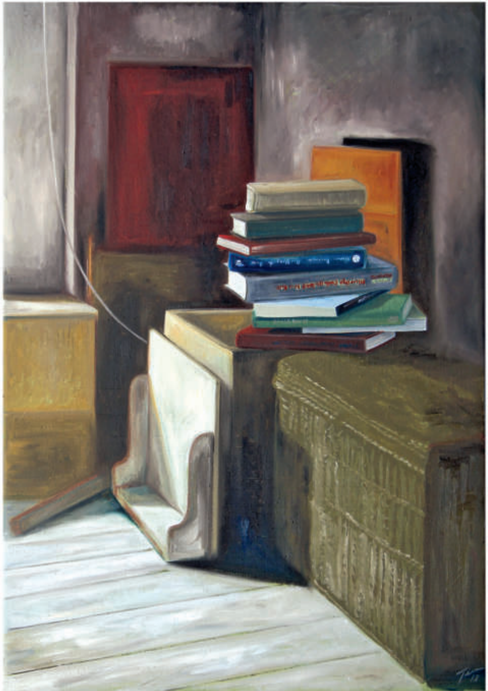
links: ex libris 21/2018/Öl auf Leinwand 90x90 cm rechts: ex libris 22/2018/Öl auf Leinwand 100x70 cm